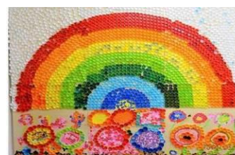
キャップアートポピー畑にかかる虹