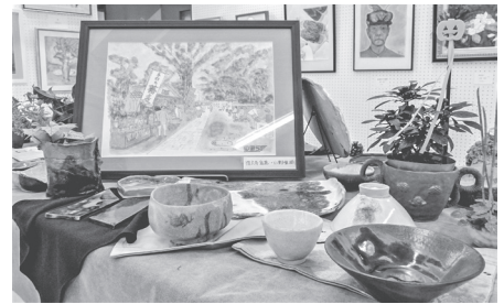
▲調布陶芸サークルの作品