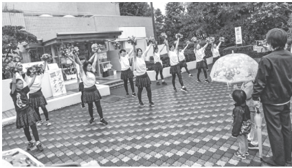
▶チェリーズによるオープニング発表