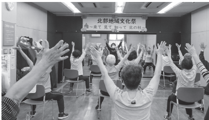
▶健康体操クラブの体験の様子