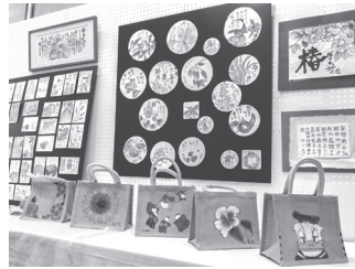
▲絵手紙サークルの作品