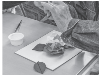
▲紙遊びの会による折り紙体験の様子

展示では他に、公民館近隣からの出展参加がありました。城山保育園の園児による創作物、神代中学校、見華学園中学校高校による美術作品、上ノ原地区生け花子ども教室による生け花作品などが並び、多くの方にご観覧いただきました。