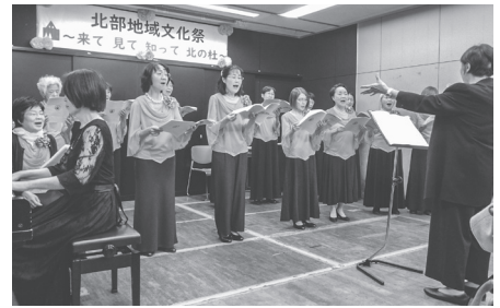
▲大町実行委員長所属の女声コーラス木曜会の発表