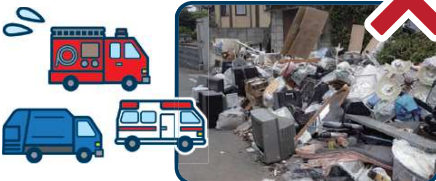
熊本地震 道路のごみ2016年