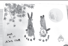
9月 あんよアート・ キーホルダー