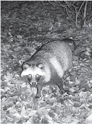
▲国際基督教大学敷地内のタヌキ

若葉町や入間町には、入間樹林や生産緑地が多く残され、タヌキを始めとする小動物の生息地となっています。これらの生息地が都市化とともに減り続け、小動物たちが食べ物やすみかを求め、生息エリアを出るようになった結果、農作物や住宅環境を荒らす害獣となる場合もあります。