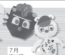
7月 折り紙・ ペーパースーツ