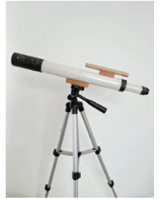
工作教室で作る望遠鏡