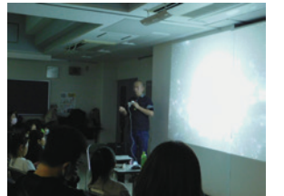
宇宙シミュレーターを使った講座の様子