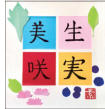
ワークショップ完成品 (イメージ)