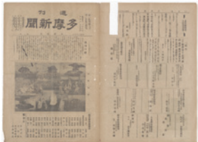
週刊多摩新聞 第一号(1面・8 面) 明治42(1909)年

新しい展示に変わる常設 展示室にて、収蔵資料の「近 藤勇養子縁組状」(市指定 文化財、寄託)と「週刊多 摩新聞」原紙を特別公開し ます。