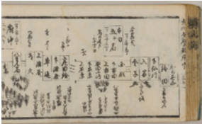
五海中細見記(部分) 安政5(1858)年刊

展示が新しくなります。 原始から現代までの調布の 歴史を、「調布のはじまり」、 「国府周辺の集落」、「武士 の時代の信仰と集落」、「江 戸とつながる村々」、「近代 化と人々の暮らし」、「発展 する調布のまち」の6つのテ マから紹介します。