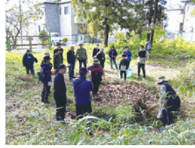
バイオネスト作成の様子