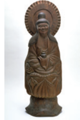
木喰明満 薬師如来坐像 1801年 実篤愛蔵

期330円 期往復はがきの往信面に講座名、応募者全 員(1枚2人まで)の郵便番号、住所、氏名(ふりが な)、年齢、電話番号、返信面にご自身の宛先を明記し、 11月23日(祝)までに実篤記念館