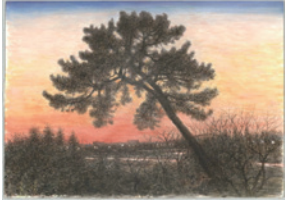
中川平一「多摩川風景(夜明け)」 2012年

●ギャラリー展「中川平一 作品からみる多摩川～郷土 博物館周辺の風景～」 (2階ギャラリー)