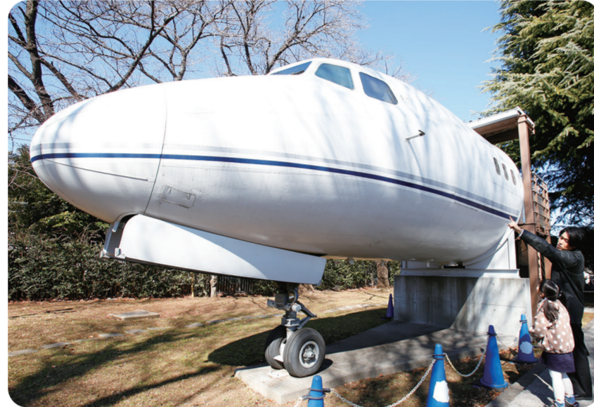
屋外には日本の技術を集めて開発されたYS-11機の一部も展示されています。

JAXA 調布航空宇宙センター展示室 〒深大寺東町7-44-1 開館時間／午前10時～午後5時 無料 事前予約不要(団体見学は要予約)。開館日・開館時間などの詳細は調布航空宇宙センター参照