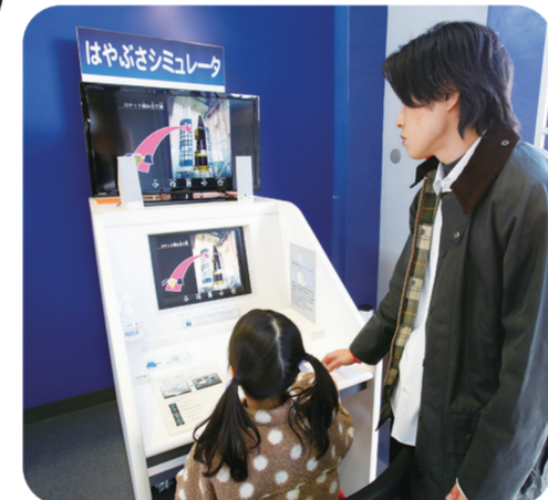
はやぶさシミュレータは「はやぶさ」が実際に行ったミッションをゲーム感覚で操作体験できます。