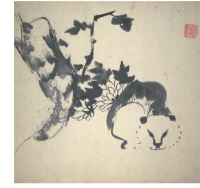
「八大山人画冊」より 中国・清代 実篤愛蔵品