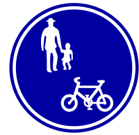
「普通自転車等及び歩行者等専用」標識

特例特定小型原動機付自転車以外の電動キックボード等は、路側帯や歩道を通行できません。