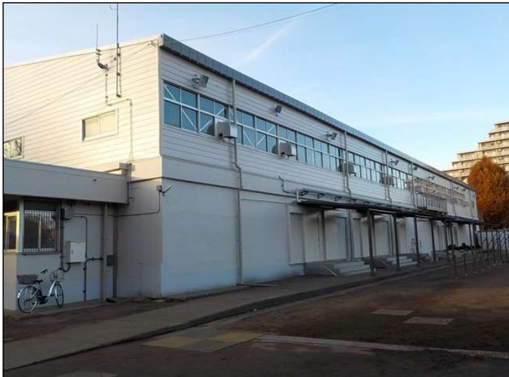
No.2 調布市立神代中学校体育館外部改修工事 外壁工事 施工完了