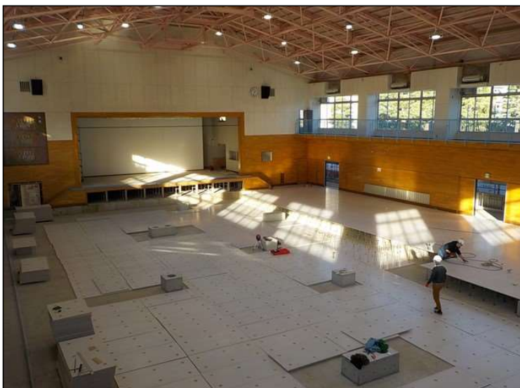
No.3 調布市立第三中学校第一体育館改修工事 アリーナ床改修 施工状況