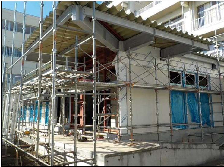
No.4 調布市立石原小学校給食室改修工事 外部工事 施工状況