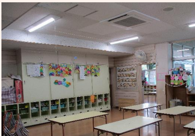
4 歳児クラス(うさぎ組)25 人 担任 2 人

幼児クラスでは、毎月図書館のお話会に出かけ、自分で選んだ絵本を一人ずつ借り、保育園でも楽しんでいきます。