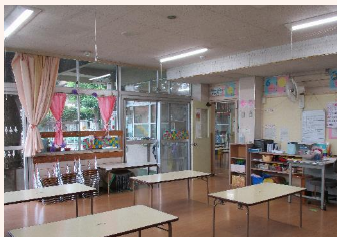
5 歳児クラス(きりん組)25 人 担任 1 人

食育の一環として、幼児は各クラスで野菜の苗を育てる体験をしています。また、秋には近隣農家の畑でお芋掘りを楽しみます。